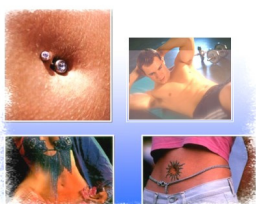
Le Pouvoir Du Nombriil

Atelier découverte pour permettre de faire l'expérience du lâcher-prise tout en reconnaissant ma capacité à laisser circuler les événements dans ma vie. Nous aborderons le cerveau émotionnel et ses 5 organes. Le Chi Neï Tsang aide à détoxiner les organes et les tissus profonds.