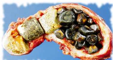
Vésicule biliaire pleine de calculs

2 heures après, prenez le 4ème et dernier verre.